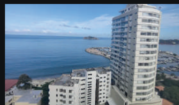
Hilton Garden Inn