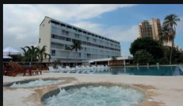
Tamaca Beach Resort