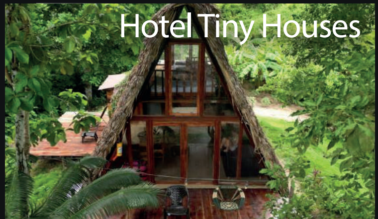
Hotel Tiny Houses