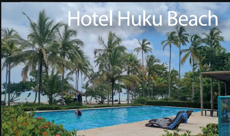
Hotel Huku Beach