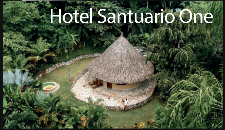
Hotel Santuario One